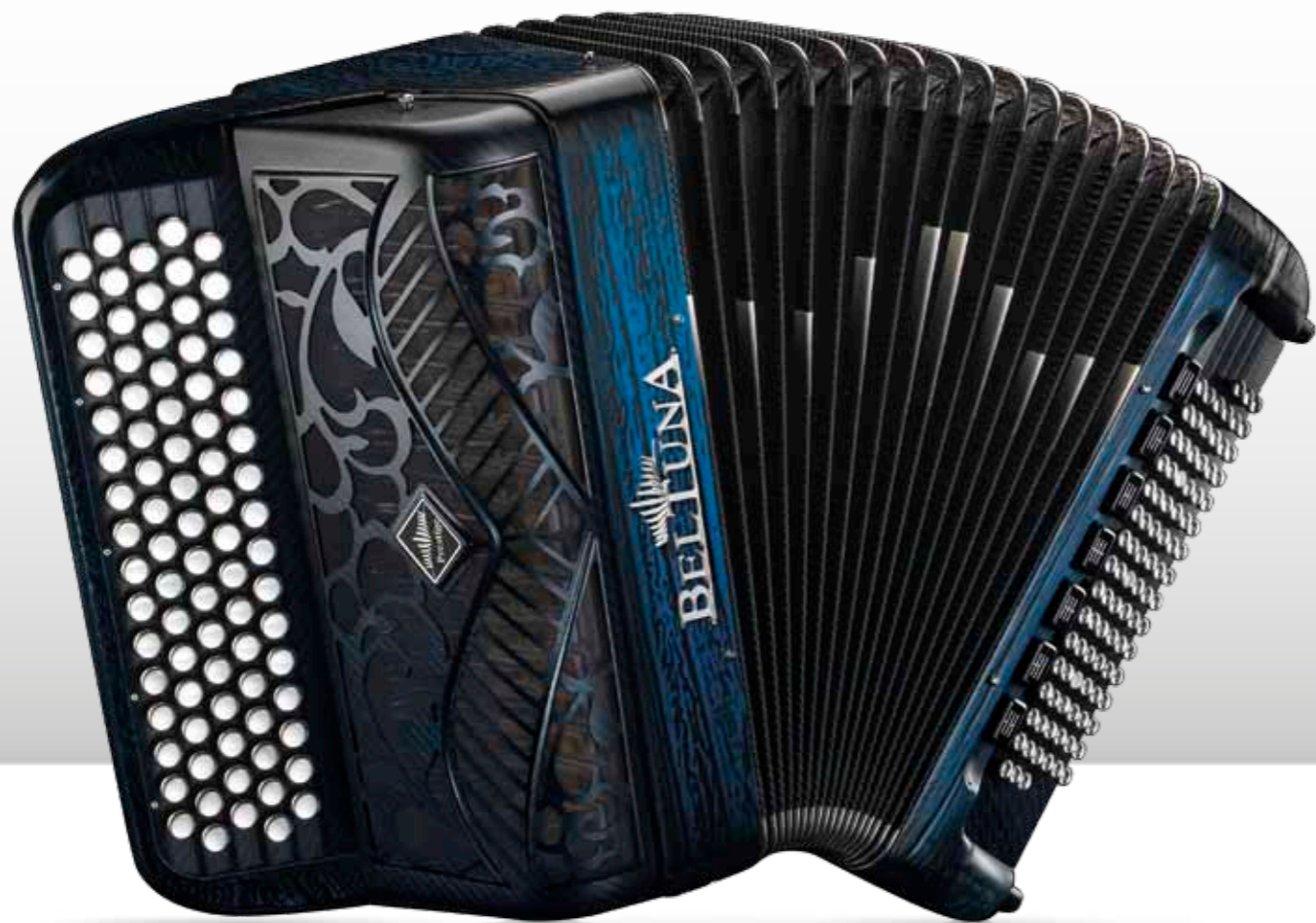
PRESTIGE 2050 DB FLY