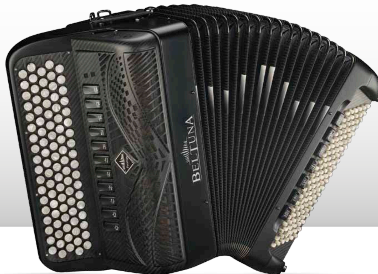
PRESTIGE 3000 FLY

Nero Opaco / Mat Black / Noir Mat / Schwarz Matt